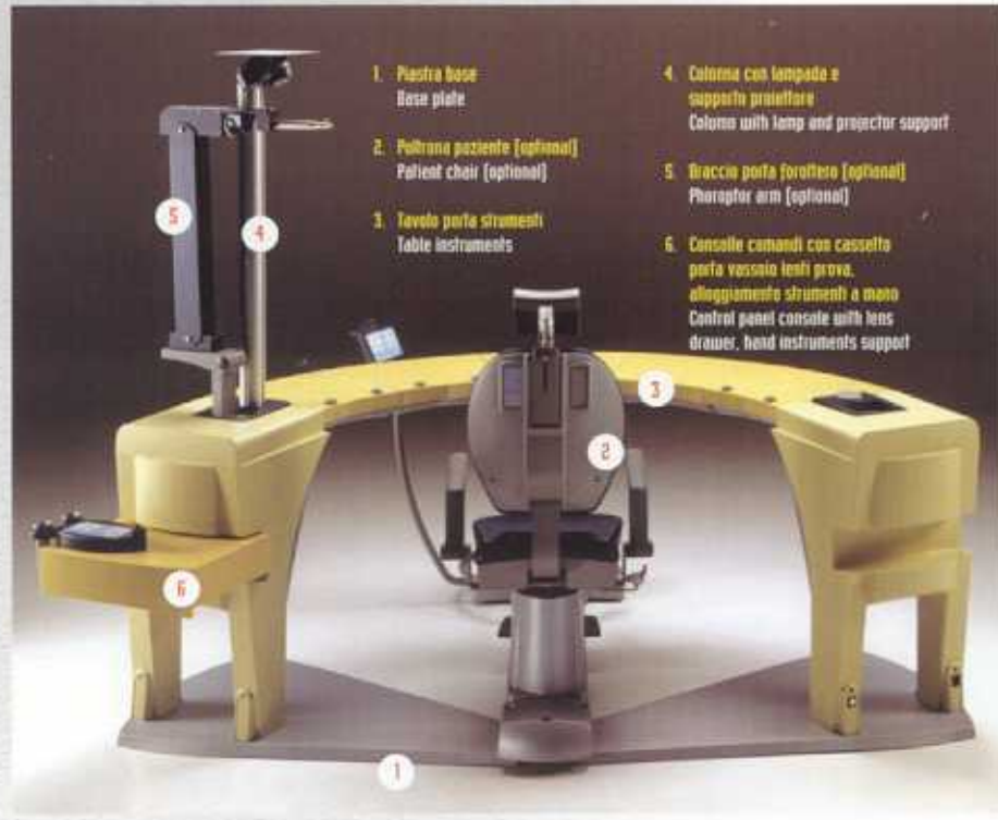
Stampato maggio 2005 - Printed in May 2005